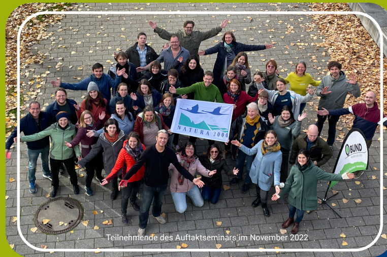
Teilnehmende des Auftaktseminars im November 2022